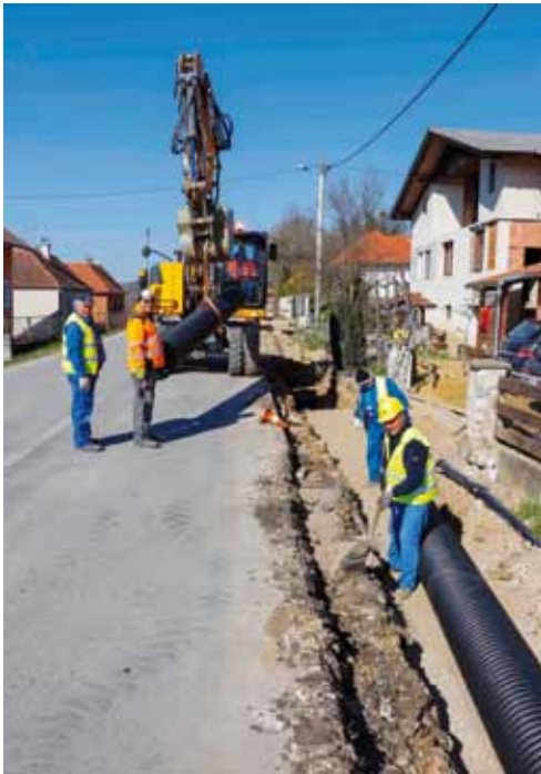
Gradnja kanalizacije u Bedencu iz EU fondova je završena; ove godine slijede radovi na Aglomeraciji Ivanec