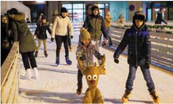
Vjerujemo da ćemo ove godine opet imati Advent u Ivancu