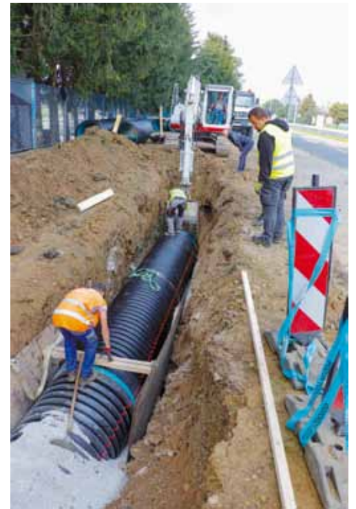
Grad pojačano ulaže u oborinsku odvodnju, isto nastavlja i ove godine