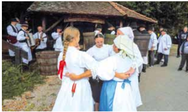
Grad je osigurao novčana sredstva za rad udruga