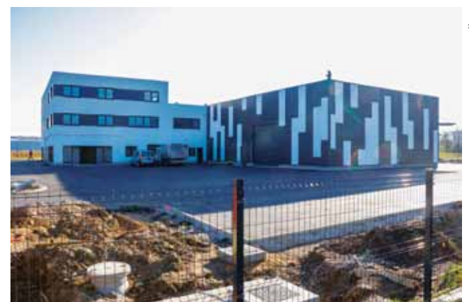
Realizacija poduzetničkih investicija u Ivancu (BGW u Industrijskoj zoni); u najavi su i nove