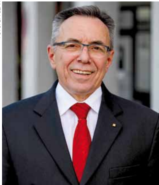
Gradonačelnik Milorad Batinić

lika gradilišta. Na njima su se odvijale i dalje se odvijaju milijune kuna vrijedne investicije i radovi.